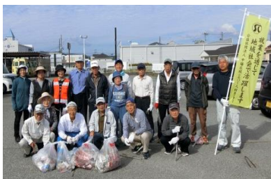
福崎町 18名参加 (町道中島～井ノ口)