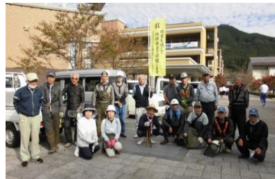
神河町 19名参加 (神河中学校)