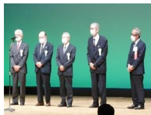
安全適正就業 特別優秀賞