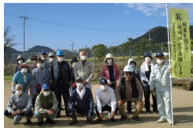
市川町 21名参加 (小室総合グラウンド)

10/15(土)2年ぶりとなるシルバーボランティアを実施しました。計58名の方に参加していただき、ゴミ拾いや草刈り・草引きなどの除草作業を行いました。早朝よりご参加いただいた皆さまありがとうございました！！