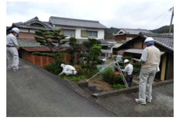
10/15 (金) 神河町 剪定現場