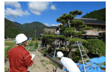
10/15 (金) 神河町 剪定現場