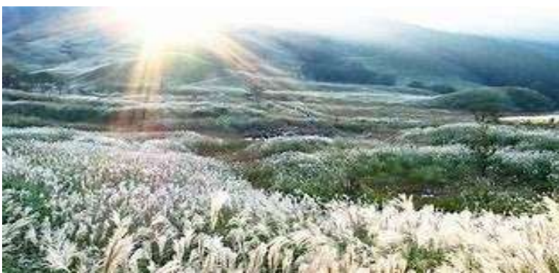
神河町 砥峰高原のすすき