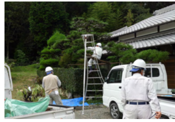
10/11 (月) 神河町 剪定、草刈現場